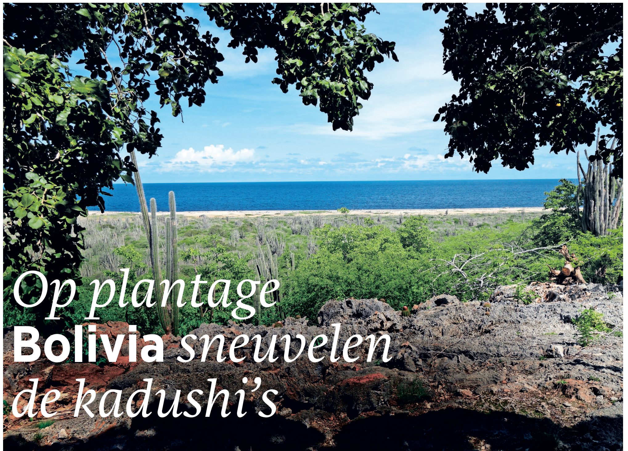
Zicht op plantage Bolivia en de Caribische Zee vanaf de klif.

BOUWPLANNEN Natuurbeschermers op Bonaire zijn bezorgd over een plan om 1500 woningen op een voormalige plantage te bouwen. Het gebied is begroeid met kwetsbaar tropisch bos. De projectontwikkelaar begrijpt de ophef niet.